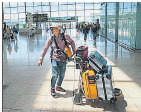
Imatge de la T1 del Prat

■ L'aeroport del Prat acumula un increment del 7,7% del trànsit de passatgers fins al mes de setembre, amb una xifra total de 36,7 milions. Durant el mes de setembre passat van passar per l'aeroport de Barcelona 4,6 milions de viatgers, un 6,4% més que l'any anterior. El trànsit domèstic va créixer un 7,2%, mentre que els usuaris internacionals van augmentar un 6%. / Redacció